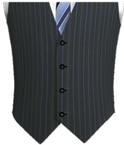
401D Single breasted 4 buttons