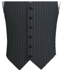
401P Single breasted 6 buttons