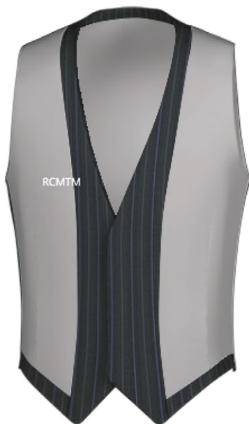
2487 Left chest