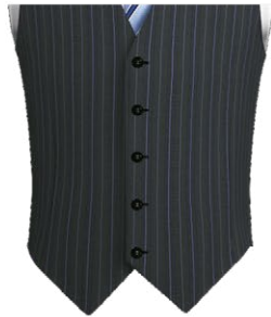
401G Single breasted 5 buttons