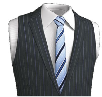
4005 Notch lapel with collar band