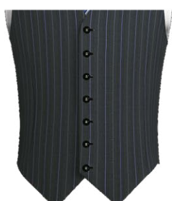
401S Single breasted 7 buttons