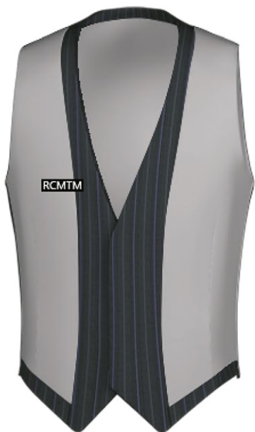
2496 Name label