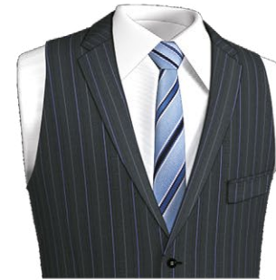
4113 Left double besom with flap pocket