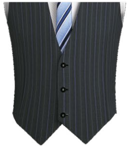
401C Single breasted 3 buttons