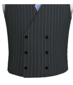
401K Double breasted 6 buttons with 3 fasten